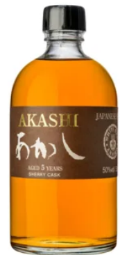
WHISKIES | SINGLE MALT AKASHI SINGLE MALT 5 ANS SHERRY CASK 50CL / 50°