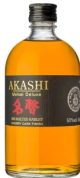
WHISKIES | BLEND AKASHI MEÏSEÏ DELUXE 50CL / 50°