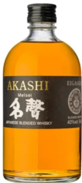
WHISKIES | BLEND AKASHI MEÏSEI 50CL / 40°