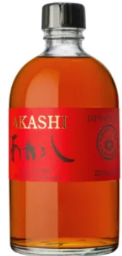
WHISKIES | SINGLE MALT AKASHI SINGLE MALT 5 ANS RED WINE CASK 50CL / 50°