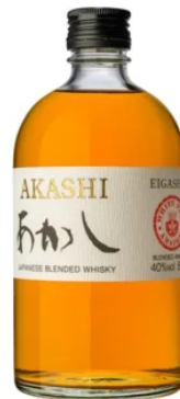
WHISKIES | BLEND AKASHI BLENDED 50CL / 40°