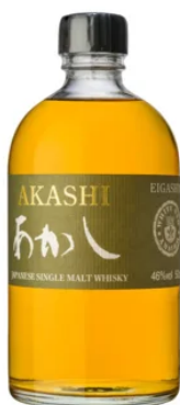
WHISKIES | SINGLE MALT AKASHI SINGLE MALT 50CL / 46°