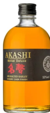
WHISKIES | BLEND AKASHI MEÏSEI DELUXE 50CL / 50°