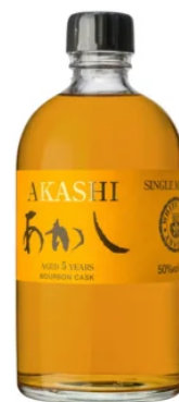
WHISKIES | SINGLE MALT AKASHI SINGLE MALT 5 ANS BOURBON CASK 50CL / 50°